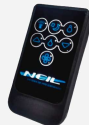
CONTROL REMOTO (OPCIONAL)