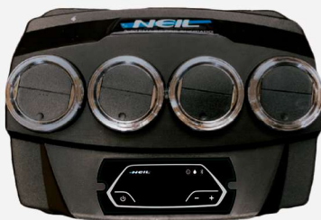
TABLERO DE CONTROL