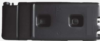
DEPÓSITO DE AGUA 16 lts