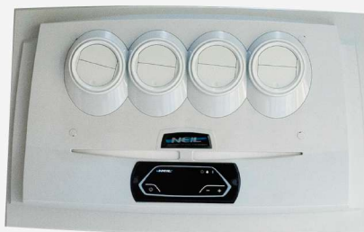
TABLERO DE CONTROL