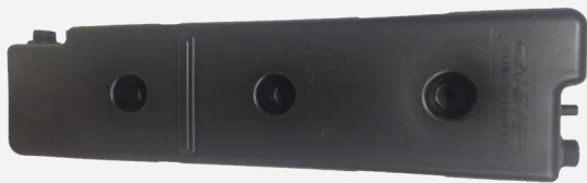
DEPÓSITO DE AGUA 16 lts